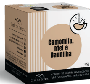
CAMOMILA, MEL E BAUNILHA 10 sachês | 10 gramas 7898646561985