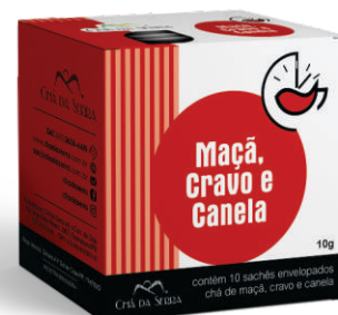
MAÇÃ, CRAVO E CANELA 10 sachês | 10 gramas 7898646561701