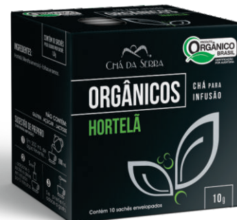
HORTELÃ 10 sachês | 10 gramas 7898646562241