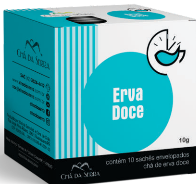
ERVA DOCE 10 sachês | 10 gramas 7898646561367