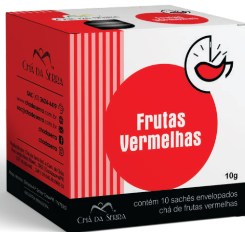
FRUTAS VERMELHAS 10 sachês | 10 gramas 7898646561770