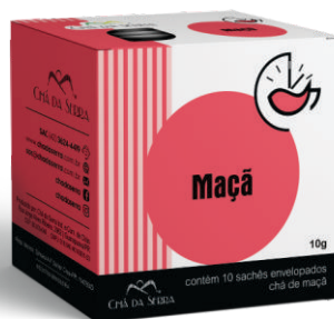
MAÇÃ 10 sachês | 10 gramas 7898646561787