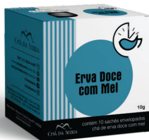
ERVA DOCE COM MEL 10 sachês | 10 gramas 7898646561763