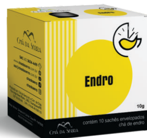
ENDRO 10 sachês | 10 gramas 7898646561688