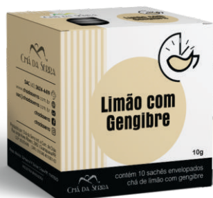
LIMÃO COM GENGIBRE 10 sachês | 10 gramas 7898646561992