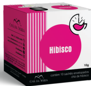
HIBISCO 10 sachês | 10 gramas 7898646561695