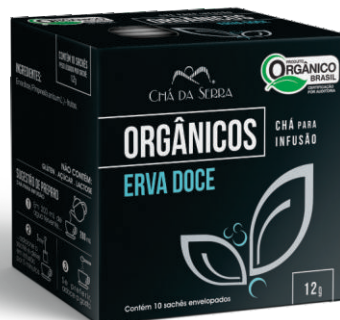
ERVA DOCE 10 sachês | 12 gramas 7898646562234