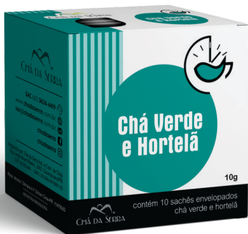
CHÁ VERDE E HORTELÃ 10 sachês | 10 gramas 7898646561671