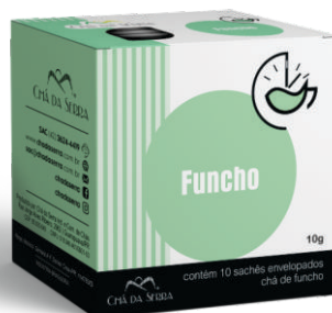
FUNCHO 10 sachês | 10 gramas 7898646561398