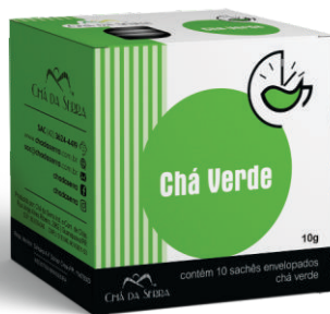
CHÁ VERDE 10 sachês | 10 gramas 7898646561664