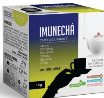
IMUNECHÁ 10 sachês | 10 gramas 7898646561947