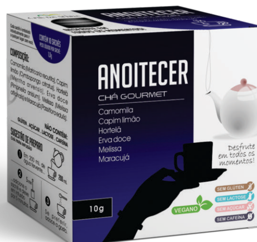
ANOITECER 10 sachês | 10 gramas 7898646562050