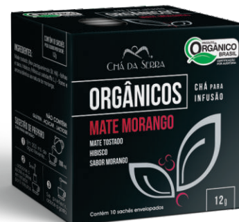
MATE MORANGO 10 sachês | 12 gramas 7898646562265