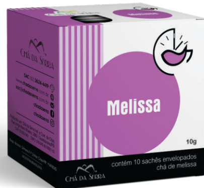
MELISSA 10 sachês | 10 gramas 7898646561404