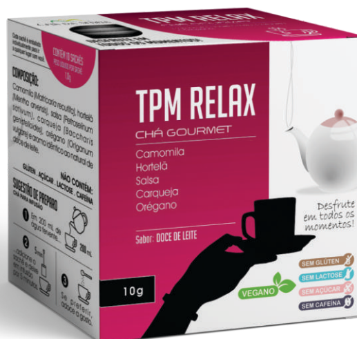
TPM RELAX 10 sachês | 10 gramas 7898646561978