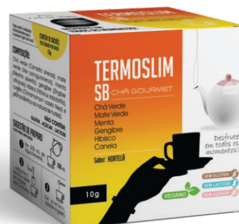
TERMOSLIM SB 10 sachês | 10 gramas 7898646561954