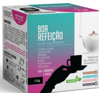
BOA REFEIÇÃO 10 sachês | 10 gramas 7898646562012