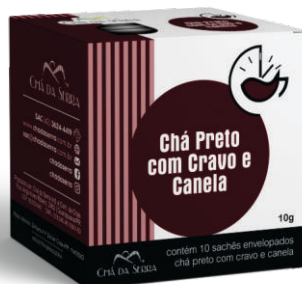
CHÁ PRETO COM CRAVO E CANELA 10 SACHÊS | 10 GRAMAS 7898646561732