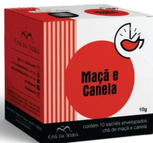
MAÇÃ E CANELA 10 sachês | 10 gramas 7898646561718