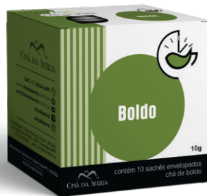
BOLDO 10 sachês | 10 gramas 7898646561640