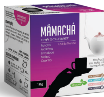
MÃMACHÁ 10 sachês | 10 gramas 7898646561930