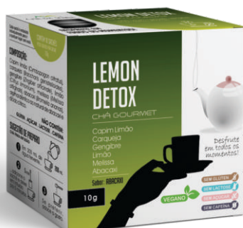
LEMON DETOX 10 sachês | 10 gramas 7898646562036