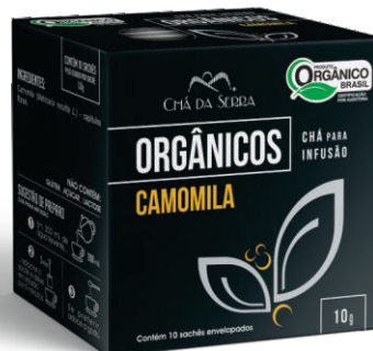
CAMOMILA 10 sachês | 10 gramas 7898646562203