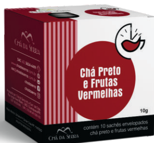
CHÁ PRETO E FRUTAS VERMELHAS 10 SACHÊS | 10 GRAMAS 7898646561749