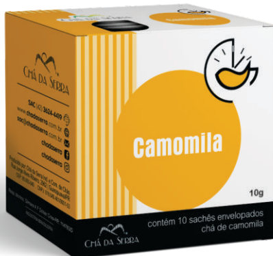
CAMOMILA 10 sachês | 10 gramas 7898646561350