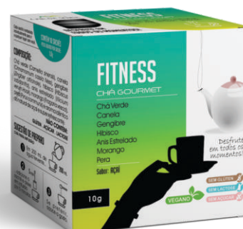
FITNESS 10 sachês | 10 gramas 7898646562029