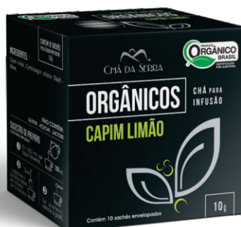
CAPIM LIMÃO 10 sachês | 10 gramas 7898646562210