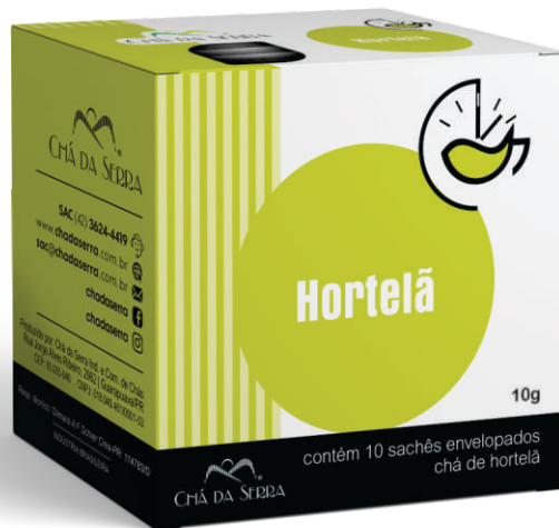
HORTELÃ 10 sachês | 10 gramas 7898646561428