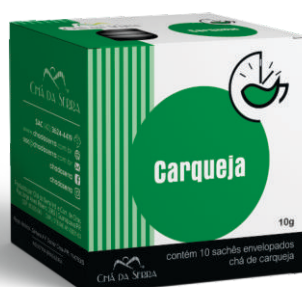
CARQUEJA 10 sachês | 10 gramas 7898646561374