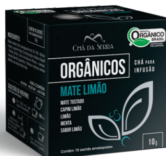
MATE LIMÃO 10 sachês | 10 gramas 7898646562258