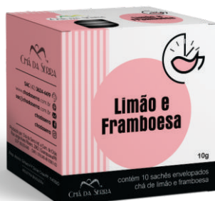
LIMÃO E FRAMBOESA 10 sachês | 10 gramas 7898646562005