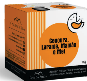
CENOURA, LARANJA, MAMÃO E MEL 10 sachês | 10 gramas 7898646562043