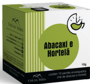
ABACAXI E HORTELÃ 10 sachês | 10 gramas 7898646561633