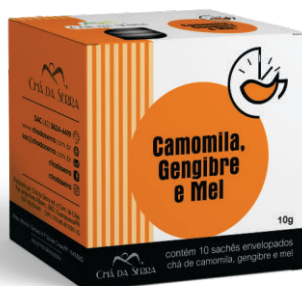
CAMOMILA, GENGIBRE E MEL 10 sachês | 10 gramas 7898646561725