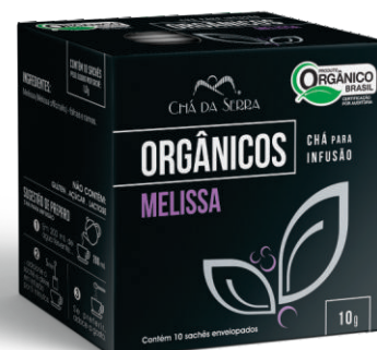
MELISSA 10 sachês | 10 gramas 7898646562289