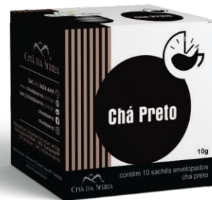
CHÁ PRETO 10 sachês | 10 gramas 7898646561657