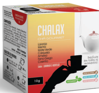
CHALAX 10 sachês | 10 gramas 7898646561961