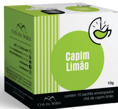
CAPIM LIMÃO 10 sachês | 10 gramas 7898646561336